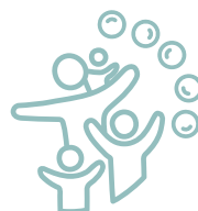
un ATELIER DE PRATIQUE PARTAGÉ entre parents et enfants

Des temps de rencontre et de partage entre les participants aux ateliers, leurs familles et les adhérents des deux associations co-organisatrices sont proposés tout au long de l'année :