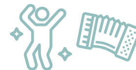
un ATELIER PARTAGÉ réunissant les participants de deux ateliers différents