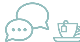
un TEMPS D'ÉCHANGE CONVIVAL en fin de trimestre