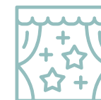
un TEMPS DE RESTITUTION COLLECTIF clôturant le cycle d'ateliers