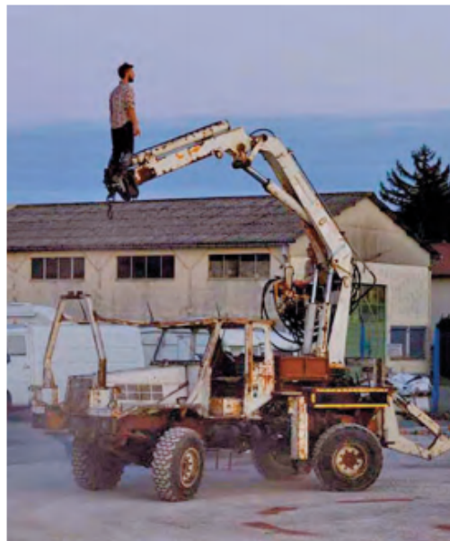
Le Cirque Pardi ! a conçu un spectacle surprenant qui réunit funambule et machinerie.

Autre parti pris des artistes : jouer la complémentarité entre les scènes contemplatives et poétiques, l'énergie des prouesses circassiennes, une musique tantôt rock et pêchue, tantôt douce et posée. Le tout saupoudré d'images projetées, façon cinéma américain des années 70-80. Une sorte de ballet mécanique, où l'humain et les machines ne font plus qu'un.