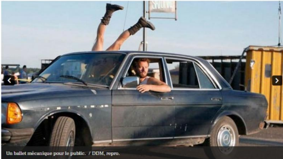
Un ballet mécanique pour le public.