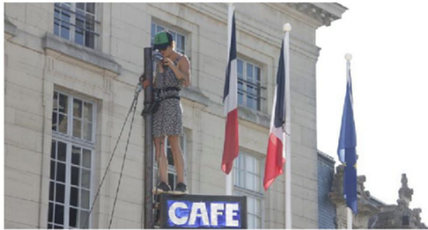
Les artistes préparent leurs décors. Ici, la chanteuse attache des câbles au sommet d'un mât posé au pied des marches de la mairie.